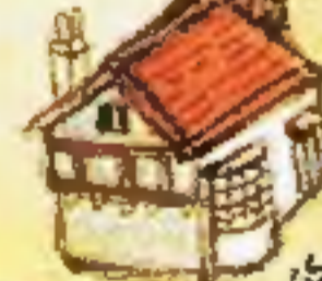
مخينة بريس بيلاك